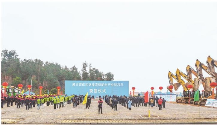
2 月 13 日，钒液流储能项目在遵义奠基。

方案设计、环评等前期工作。一期项目预计 2025 年建成，全部项目预计五年内完工。一期投运后，年产值可达 100 亿元以上，其中，出口额 20 亿元以上，提供超 800 个就业岗位，助力新蒲新区打造“钒储能之都”。