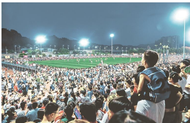
“村超”现场。

2月5日，省委、省政府召开全省现代化产业体系建设推进会，提出要构建现代旅游业体系，聚焦资源客源服务三大要素，开发新场景、打造新产品、满足新需求，打造世界级旅游目的地。近年来，围绕自然珍宝、文化瑰宝“两个宝贝”，贵州不断强化世界级旅游景区景点、一流旅游城市“两大支撑”，持续推进旅游产业化“四大行动”，聚焦资源要素构建串珠成链、点面结合的旅游支撑体系，聚焦客源要素构建国内国际相结合的旅游营销体系，聚焦服务要素构建高质优效的旅游服务体系，聚焦强基固本构建充满活力的旅游市场主体体系，聚焦环境建设构建安全高效的现代旅游治理体系，推动现代旅游业体系提档升级。