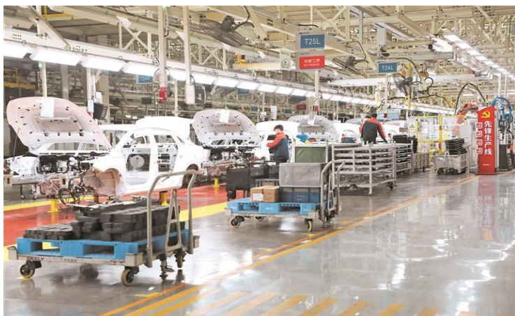
吉利生产车间

车产业，通过前瞻布局，依托龙头企业，不断完善产业链体系。目前，已拥有 30 家汽车配套零部件企业，产品覆盖了电池、冲压件、座椅等多个领域。去年，观山湖区汽车及配套产业产值超 160 亿元。