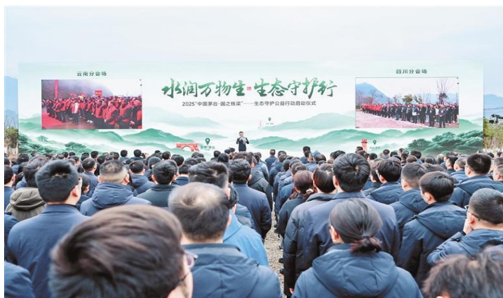
贵州仁怀、云南镇雄和四川古蔺三地联动开展生态守护公益行动启动仪式。

纸制成，嫩绿的卡片上压印着赤水河简笔轮廓。活动期间三地联动开展的植树、巡河等活动，更与赤水河流域沿线地方政府及企业在生态维度达成同频共振——绿色发展理念既需要破土萌芽的信念，更依靠薪火传承的坚守。