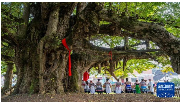
毕节市小坝镇莺戈岩村树龄超过1700年的古银杏树。