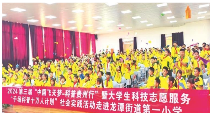
科普活动现场。

2024 第三届“中国飞天梦—科普贵州行”暨大学生科技志愿服务“千场科普十万人计划”社会实践活动在全省 60 余个县（区）开展航空航天科普志愿服务 514 场，累计科普 110395 人，总行程 8447.669 公里，在广大青少年心中种下了“飞天梦”“强国梦”的种子。