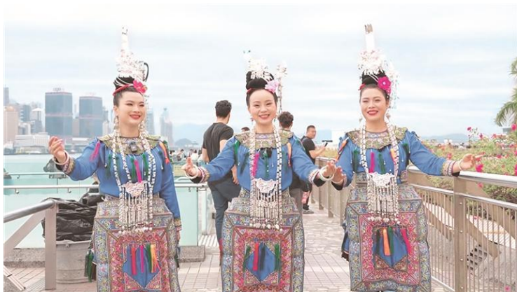
贵州侗族大歌唱响香港维多利亚港。