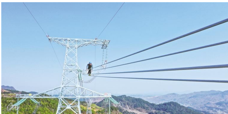
南方电网凯里供电局工作人员对 500 千伏福施 II 回线投运前进行走线验收。