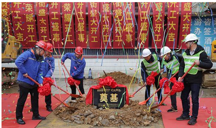
白云 1958 文旅街区项目开工仪式现场。