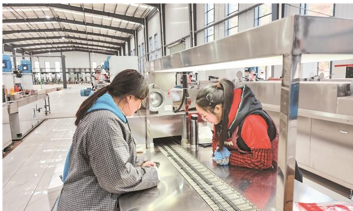
贵州晶源磁业科技有限公司质检员在检测磁芯。

2 月 14 日，贵州炉碧经开区的贵州晶源磁业科技有限公司年产 50 亿付软磁铁氧体磁芯项目生产现场，工人正在调试机器，检测磁芯，进行试产。该项目总投资 1 亿元，新建 6 条生产线，主要生产铁氧体磁芯、电子变压器、无线充电器。项目达产后，预计实现年产值 1 亿元，年缴纳税收 300 万元，解决就业 200 人。项目全部投产后，投资的晶磁、晶源、晶辉三家公司铁氧体磁芯年产量将达到 80 亿片，产值有望突破 3 亿元。