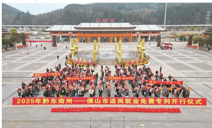
黔东南州—佛山市返岗就业免费专列开行仪式现场。

2月5日，2025年黔东南州——佛山市返岗就业免费专列开行仪式在黔东南州从江县高铁站广场举行，有组织输送从江、榕江、凯里等县市的600余人返岗就业。图为专列开行仪式现场。