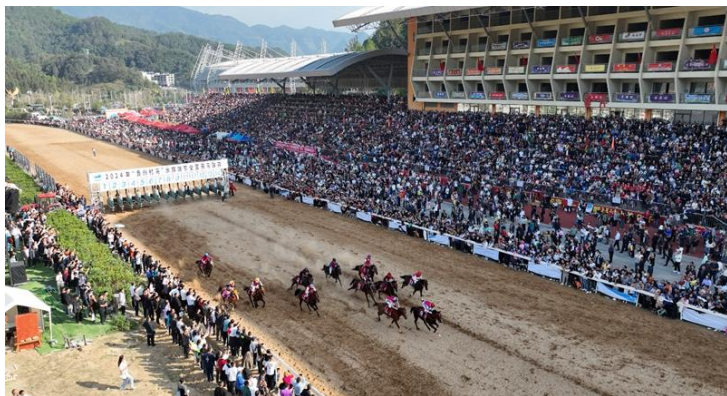
“贵州村马”活动现场。