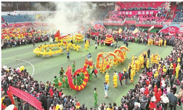
石阡县 2025 年“侗佬毛龙节”活动上的舞龙表演。