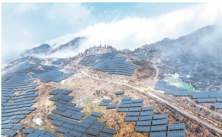
六盘水市六枝特区郎岱镇境内的老虎大坪光伏电站。