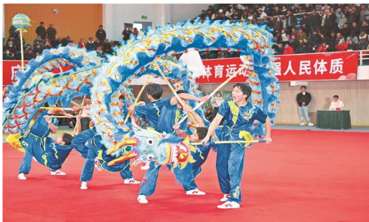
全国舞龙公开赛（贵州·余庆站）现场。