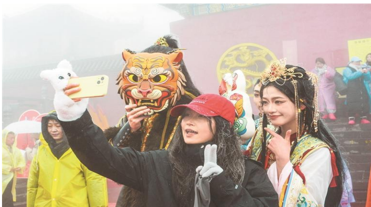
“梵净山十二生肖奇遇记”活动现场。