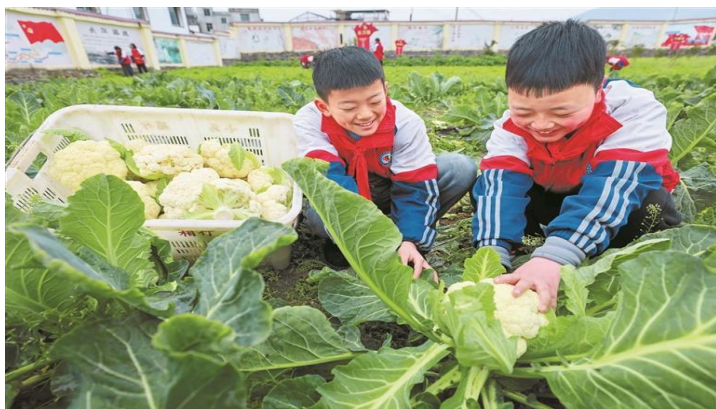
学生在采收花椰菜。

2 月 17 日，遵义市正安县安场镇石井小学将课堂搬到校内劳动实践基地，让学生以化身“小农人”的方式开启新学期。黔南州贵定县实验第四小学（二小分校）以“开学季 ‘嗨’ 科技”为主题，迎接新学期的到来。